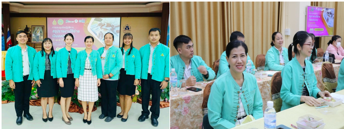
ภาพที่ 9-10 แสดงการประชุมเชิงปฏิบัติการสรุปรายงานการใช้จ่ายเงินงบประมาณ ปี พ.ศ.2566

กิจกรรมที่ 5: การพัฒนา ส่งเสริมผู้บริหาร ครูและบุคลากรทางการศึกษาเกี่ยวกับความสำคัญของการป้องกันการทุจริตและวิธีการป้องกันในการปฏิบัติงานให้ถูกต้องตามระเบียบ ข้อบังคับ กฎหมาย ได้แก่ การประชุมเชิงปฏิบัติการสรุปรายงานการใช้จ่ายเงินงบประมาณ ปี พ.ศ.2566