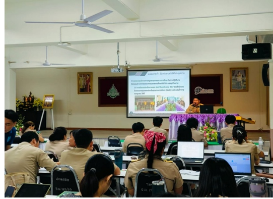
ภาพที่ 5-6 แสดงกิจกรรมการถ่ายทอดและปลุกฝังบุคลากรให้รับทราบถึงคุณธรรมและความโปร่งใสในการทำงาน ผ่านการประชุมข้าราชการครูและบุคลากรทางการศึกษา ประจำเดือน

กิจกรรมที่ 4: การจัดประชุมคณะกรรมการสถานศึกษาขั้นพื้นฐาน และการประชุมข้าราชการครู บุคลากรทางการศึกษาประจำเดือน เพื่อชี้แจงรายละเอียดการใช้งบประมาณ และเสนอพิจารณาอนุมัติงบประมาณตามแผนปฏิบัติการประจำปีการศึกษา 2566