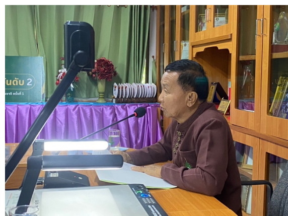
ภาพที่ 7-8 แสดงการจัดประชุมคณะกรรมการสถานศึกษาขั้นพื้นฐาน