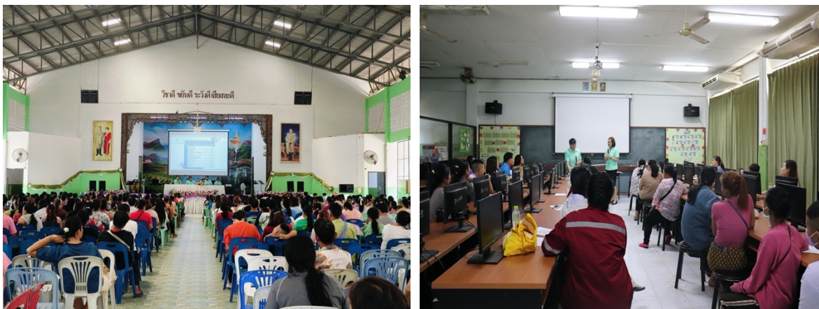
ภาพที่ 11-12 แสดงการประชุมผู้ปกครองนักเรียนประจำภาคเรียนที่ 1-2 ปีการศึกษา 2566

กิจกรรมที่ 6: การจัดการประชุมผู้ปกครองนักเรียนประจำภาคเรียนที่ 1-2 ปีการศึกษา 2566 เพื่อนำเสนอนโยบายการบริหารสถานศึกษา ผลการดำเนินงานของสถานศึกษา